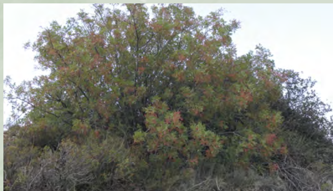
Pistacia terebinthus , τρεμιθιά

Το κύριο δασικό δέντρο που συναντά κανείς κατά μήκος της διαδρομής είναι η Τραχεία πεύκη ( Pinus brutia ) καθώς και πολλά είδη θάμνων, όπως τα ρασιά ( Genista fasselata subsp. fasselata ), οι σχιινιές ( Pistacia lentiscus ), οι ξισταρκές ( Cistus spp. ), τα μαζιά ( Sarcopoterium spinosum ), τα θρουμπιά ( Coridothymus capitatus ) ( Thymus capitatus ), οι καππαρκές ( Capparis spinosa var. canescens ), τα φασσόχορτα ( Prasium majus ) και άλλα πολλά.