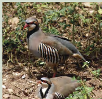
Alectoris chukar , πέρδικα