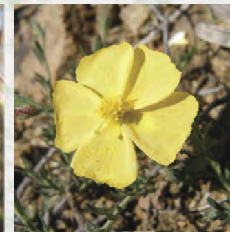
Fumana thymifolia , τραανίδιν