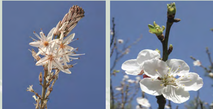
Asphodelus aestivus , σπουρτούλα Prunus armeniaca , χρυσομηλιά