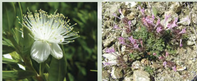
Myrtus communis , μερσιλιά Thymus integer , θυμάρι