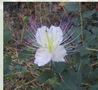
Capparis spinosa var. canescens , καππάριν