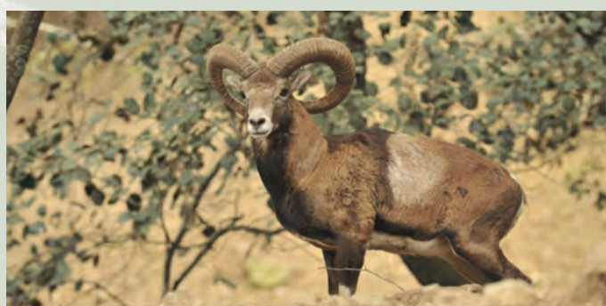
Ovis orientalis ophion , αγρινό

Το μονοπάτι καθώς και όλο το Δάσος Πάφου αποτελούν Ζώνη Ειδικής Προστασίας για τα πουλιά (SPA), έτσι οι λάτρεις της πανίδας μπορεί να συναντήσουν πουλιά, μικρά ζώα και έντομα καθώς και το ενδημικό αγρινό.