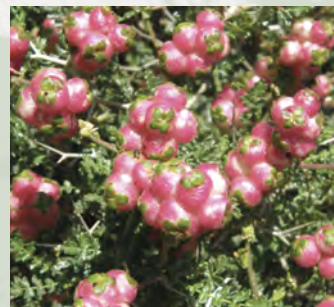
Sarcopoterium spinosum , μαζίν