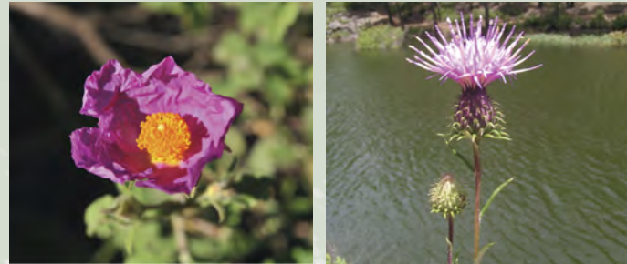
Cistus creticus subsp. creticus , ξισταρκά Ptilostemon chamaepeuce var. cyprius , χαμαιπέυκη, αρκολασμαρίν